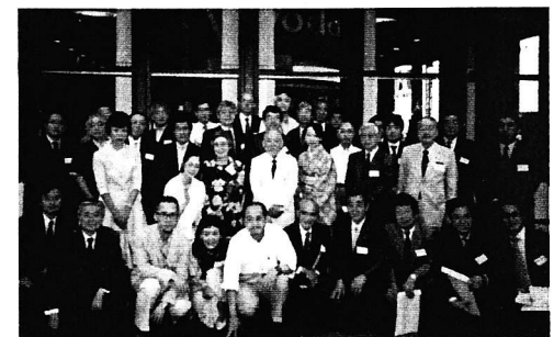
2005・6・29 総会懇親会 (サ・ホロ銀座ビル 「スターホール」)