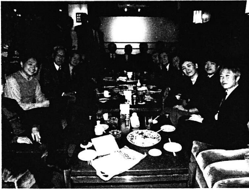
2005・1・22 新年会 (マクマにて)