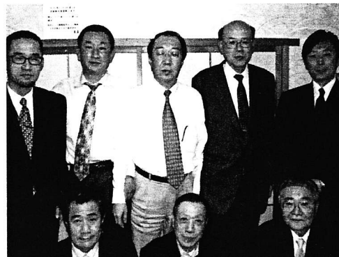
2005・12・16 幹事顧問忘年会 (月島ほていさんにて)