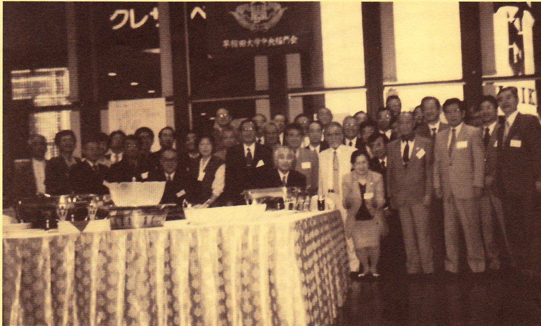
出席者全員で記念撮影

中央区勝ちどき4-13-2-201 TEL 03-5560-8751 FAX 03-5560-8752 発行人 藤井 昭世 編集人 松川 中見 題字 松川 昭世 和義子 堂