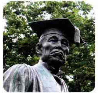
早稲田の薫 ネクタイ

スカーフには、大隈重信侯が慈しみ育てていた西洋蘭「早稲田の薫」をデザインしました。