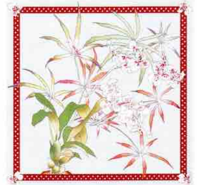
早稲田の薫 スカーフ

1点につき¥500を、早稲田大学創立125周年記念事業に寄付します(年2回まとめて、中央稲門会125寄付事業部より大学に寄付)。地域・職域稲門会で取りまとめて頂いた分については、とりまとめ稲門会の寄付実績となります。